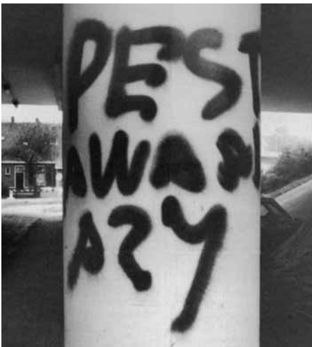
PEST LAWAAI A27

Het broeide al onderhuids en het ongenoege zoekt een uitweg. In een druk bezochte commissievergadering AZ/RO wordt door een vertegenwoordiger van het Comité A27 gewaarschuwd voor subversieve acties.