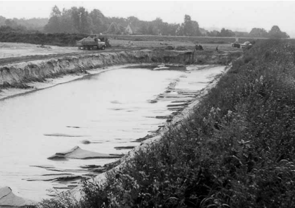
De put van Blauwendraad in wording. Deze natte ontgroning was gelegen ten noorden van de Nieuwe Weteringsegeweg, dichtbij het viaduct over de spoorlijn en het tracé van de rijksweg. Aan het begin van de betreffende percelen staan nu twee borden van Bomencentrum Nederland B.V.