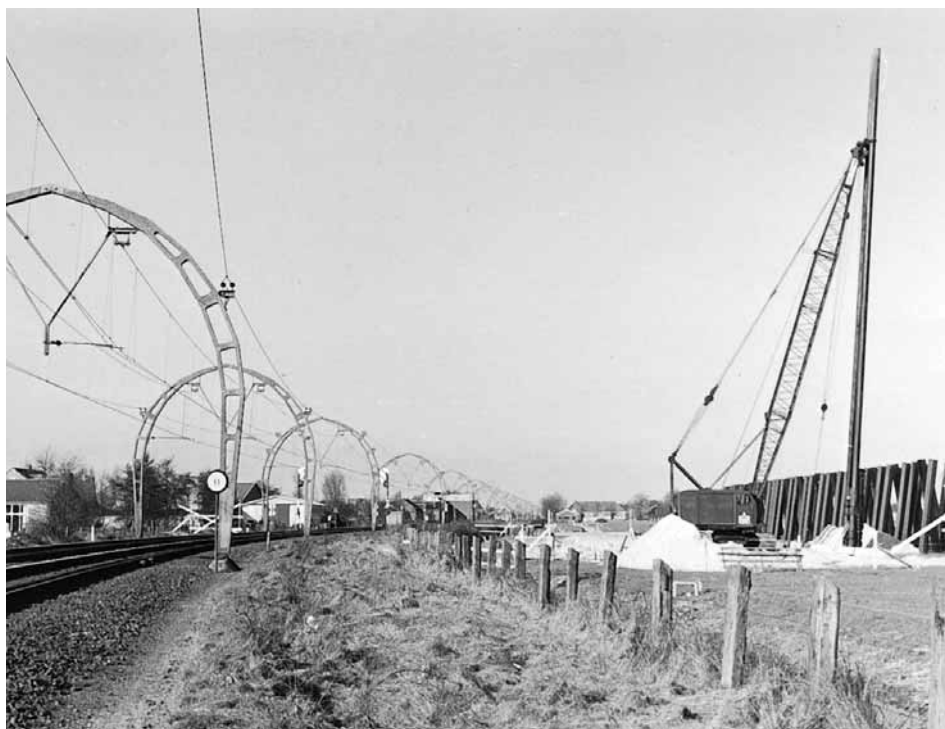
Foto gemaakt vanaf Blauwkapelseweg richting Groenekan. Links is nog het padvindershuisje te zien, nu staat zwembad Blauwkapel hier.

december 1969 de woning met al het zijne en de zijnen te verlaten en geheel ontruimd aan eiser op te leveren”.