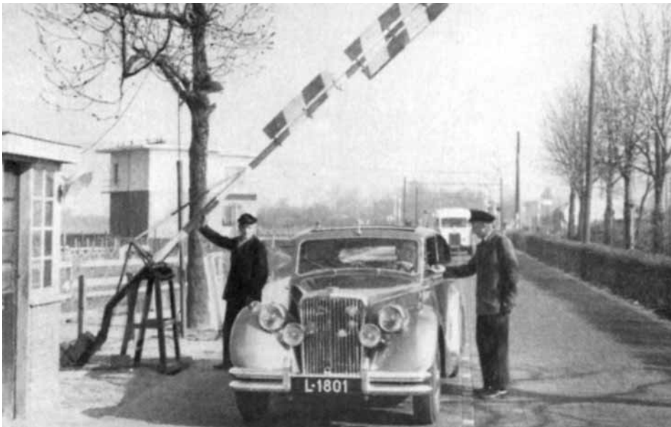
Tol aan de Hogedijk in Tuindorp.

nomen, wordt in 1920 het Nederlandse Wegcongres gehouden. Een commissie uit dit congres maakt een plan om de weggebruikers in de kosten van de reconstructie van het wegennet te laten meebetalen. Op basis hiervan komt op 30 december 1926 de Wegbelastingswet tot stand. In het volgend jaar, 1927, wordt als uitvloeisel van deze wet, het eerste Rijkswegenplan 1928 vastgesteld, gevolgd door de eerste provinciale wegenplannen. Dit is het begin van de ontwikkeling van het gehele wegensysteem in Nederland. Al in 1932 wordt het plan herzien om vervolgens elke tien jaar te worden bijgesteld. Wie dit plan bestudeert, ziet dat de voorloper van de A27, de N22, in het wegenplan is opgenomen.