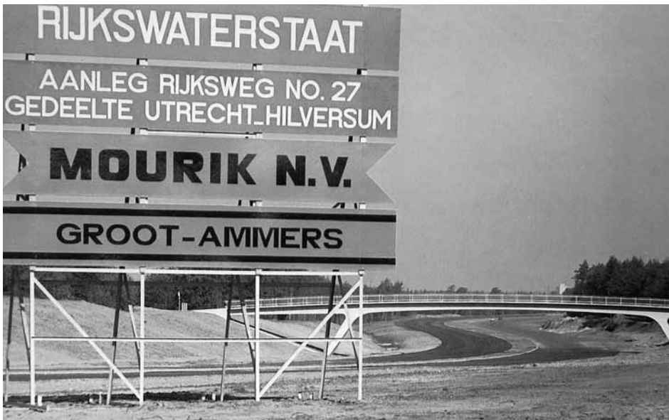
Joh. Mourik en Co N.V. werd de aanleg van de weg gegund. Kunstwerk (brug) ten noorden van Hollandsche Rading richting Hilversum.