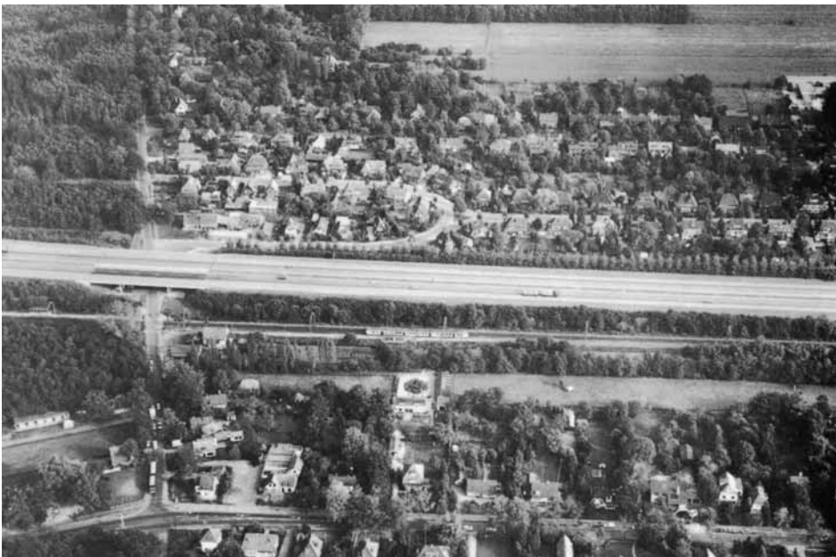
Hollandsche Rading. Cumulatie geluid. Duidelijk zijn de drie bronnen: de rijksweg, het spoor en de provinciale weg te onderscheiden.